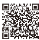
名古屋公演 Youtube サイト

当日上演される演目の解説など、能を楽しむための情報を集めたチャンネルを開設しました。初めて能をご覧になる方も、お気軽にご覧下さい。