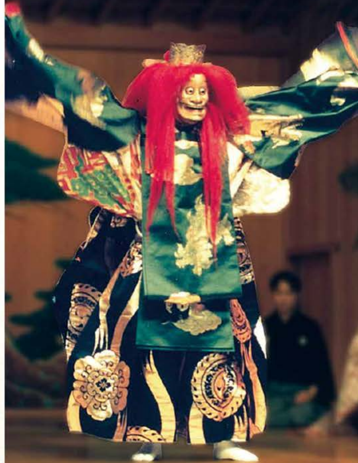
【嵐山】三世 梅若万三郎