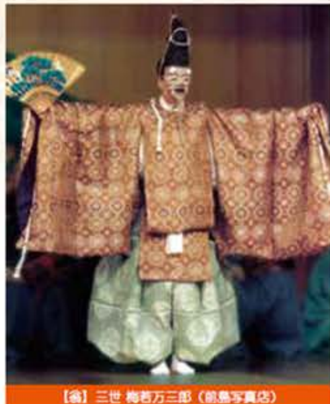
【翁】三世 梅若万三郎