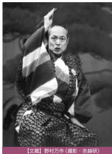
【文蔵】野村万作