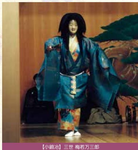
【小鍛冶】三世 梅若万三郎